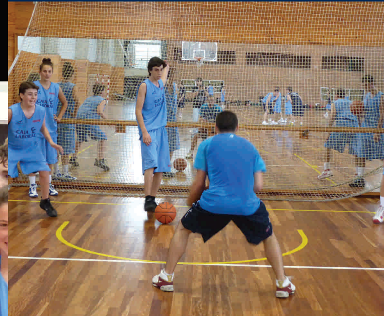
Dirigido por: David Gil - Entrenador ayudante del Caja Laboral

CAMPUS INTERNACIONAL 2010 + DE 10 PAISES REPRESENTADOS www.campusinternacionalbaloncestobaskonia.com